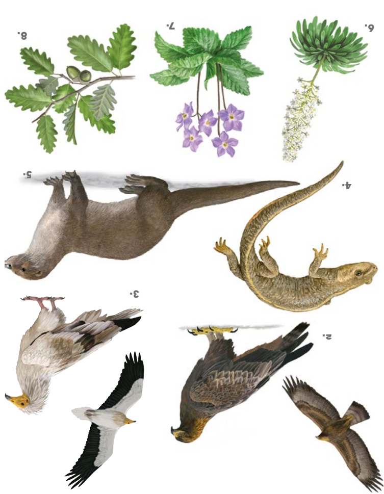
Dibuixos: Toni Llobet

Fauna i flora Les parets i roquissars de l'estret congost, són un dels ambients més singulars de l'espai, on hi creixen plantes curioses com l'orella d'ós i la corona de rei, i nien rapinyaires com el tencalós, l'àliga daurada o el voltor comú. A més dels pinya-segats i del riu, on de vegades s'hi veuen lúdrigues, trobem diversos am- bients segons l'orientació dels vessants. A les obagues hi ha denses rouredes, i la vegetació mediterrània domina les solanes amb alzinars, boxeders i broles. La carena del Montsec, seca i fortament batuda pel vent, es cobreix de prats secs i matollars. La gran biodiversitat de l'indret es completa amb els ambients caver- coles de coves i avencs, refugi de rat-penats i altres animals del medi subterrani.